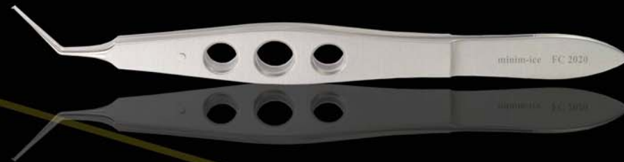
FC 2020: PINZA CAPSULORRESIS "MINIM-ICE 1.6", MANGO PLANO, PALAS RECTAS, C/D.