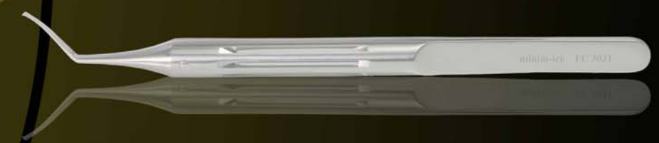
FC 3031: PINZA CAPSULORRESIS "MINIM-ICE 1.6", MANGO REDONDO, PALAS CURVAS, C/D.