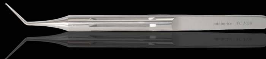
FC 3030: PINZA CAPSULORRESIS "MINIM-ICE 1.6", MANGO REDONDO, PALAS RECTAS, C/D.